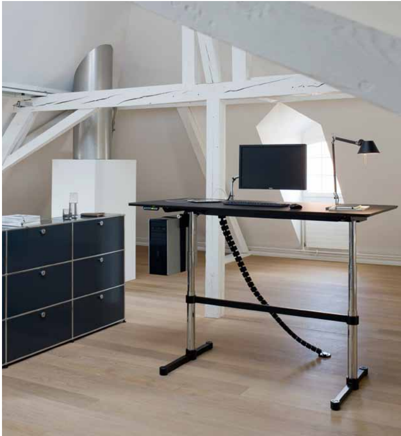
Kitos von USM – ein universelles und flexibles Sitz-Steh-Tischsystem für hohe Ansprüche an Design und Funktionalität.

Die tägliche Büroarbeit fast ausschließlich im Sitzen zu erledigen, wirkt sich nicht nur negativ auf die Gesundheit, sondern auch auf Leistungsfähigkeit und Wohlbefinden aus. Mit der Nutzung sogenannter Sitz-Steh-Lösungen kann dem leicht entgegengewirkt werden. Dr. Robert Nehring, Chefredakteur von Modern Office, mit einem Plädoyer für mehr Steharbeit im Büro.