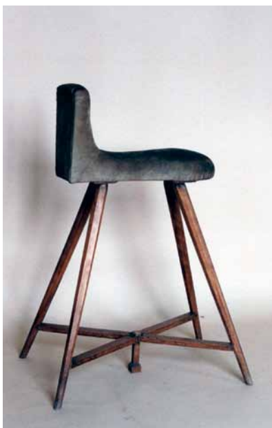
Ein mit Ziegenleder bezogener Schreibbock, den Goethe »besessen« hat.

In diesem Jahr haben sich wichtige Branchenplayer zu einem Aktionsbündnis für eine größere Verbreitung und Nutzung von Sitz-Steh-Lösungen zusammengeschlossen. Die Aktion »Aufstand im Büro« wurde von der I.O.E. Initiative Office-Excellence und dem Magazin Das Büro ins Leben gerufen. Unterstützt werden sie aktuell vom I.O.E.-Partner WINI Büromöbel, den Premium-Partnern der Aktion König + Neurath und Kinnarps, den weiteren Herstellern Aeris Impulsmöbel, C+P Möbelsysteme, CEKA, Hund Büromöbel, Fleischer Büromöbelwerk sowie dem Deutschen Netzwerk Büro (DNB) und dem Bundesverband Bürowirtschaft (BBW). Interessierte finden mehr Hintergrundwissen und praktische Lösungen unter www.büro-aufstand.de .