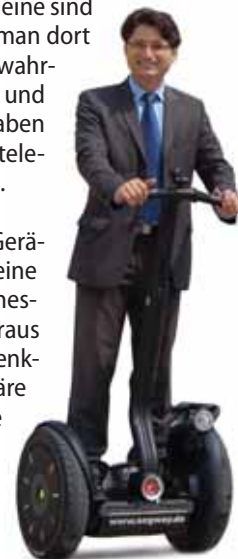
Die Krönung mobiler Büroarbeit – Fortbewegung mit dem Segway-Roller (ab ca. 6.000 €).